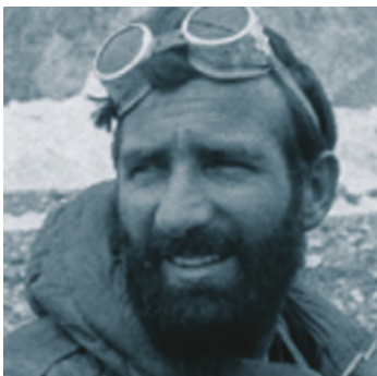
Cirillo Floreanini fondatore della Scuola